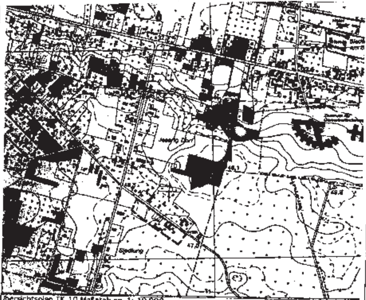
Übersichtsplan TK 10 Maßstab ca. 1:10.000