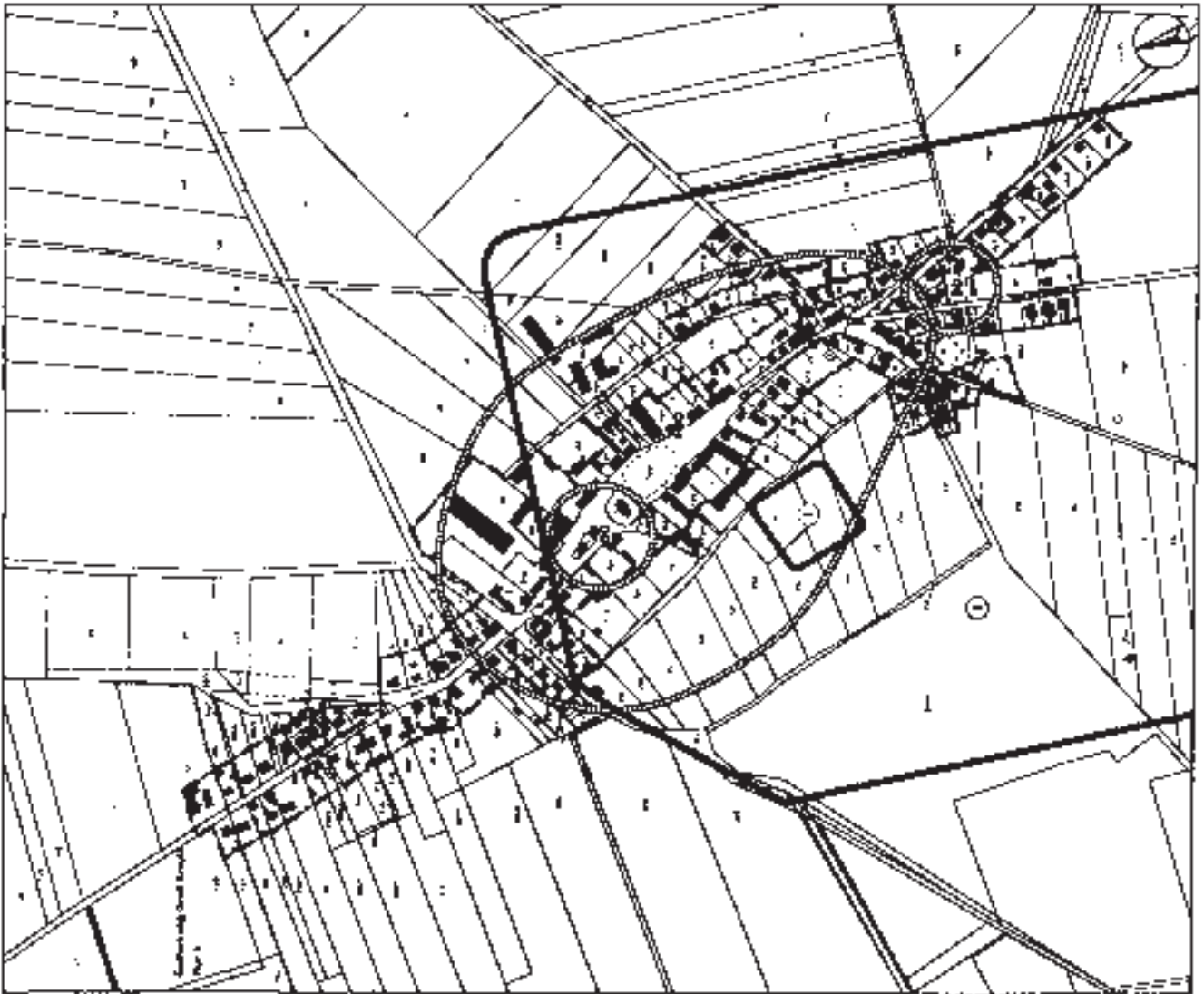
Teilzeichnung 1: Bochow Dorf (Gemarkung Bochow - Flur 2)