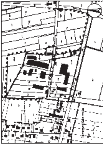
Teilzeichnung 3: Groß Kreuz, Bereich Bochow Bruch (Gemarkung Bochow, Flur 1)