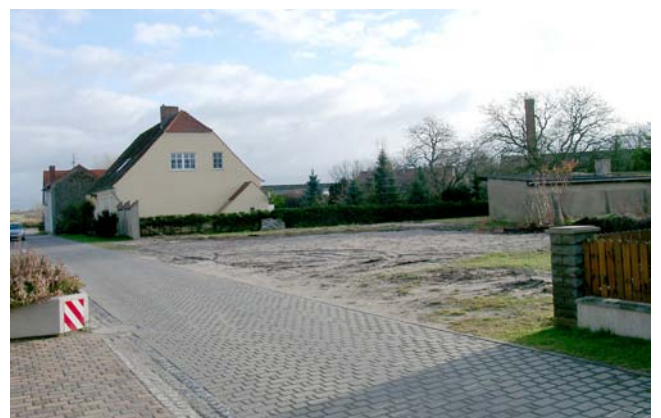
Blick von der Straße „Heuberg“ auf die Nordwestecke der Grundstücke