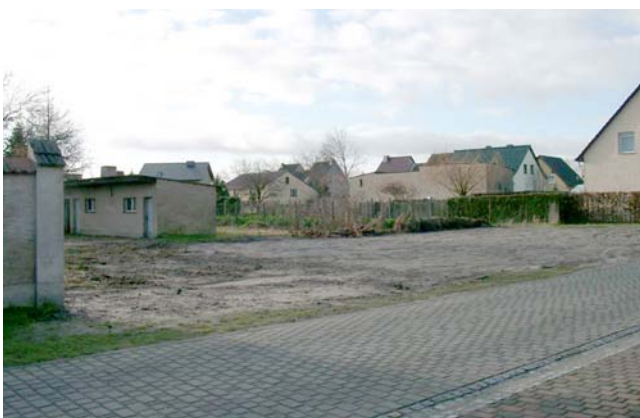
Blick von der Straße „Heuberg“ auf die Nordostecke der Grundstücke