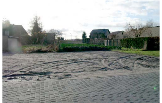
Blick nach Süden von der Straße „Heuberg“ auf das Grundstück „Heuberg 35“