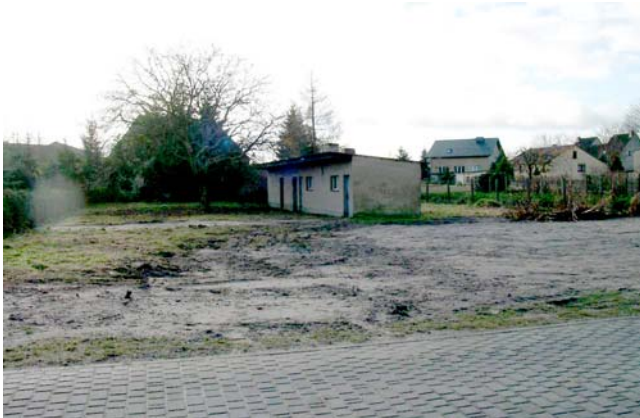
Blick nach Süden auf das Grundstück „Heuberg 37“ mit dem Nebengebäude