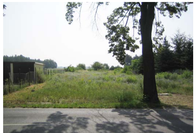
Blick über das Grundstück nach Osten