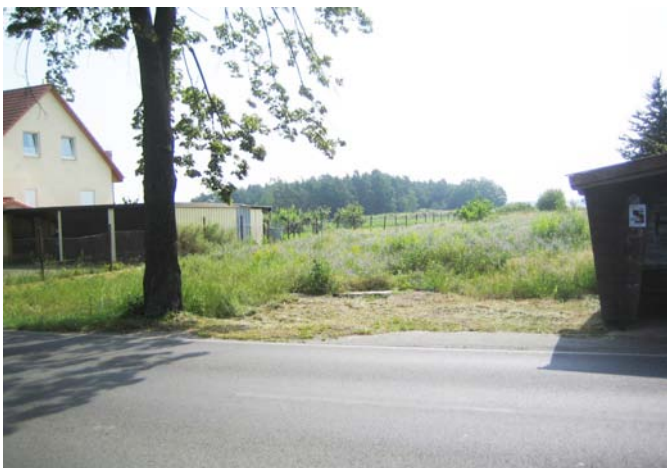
Blick auf Grundstück und Nachbarhaus